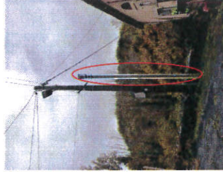
BT1 - Lous Aors 43.579642, 2.393343