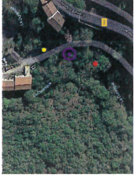
FTAC2 - Rue de la Salette 43.574876, 2.377824