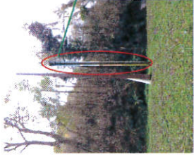
BT12 - Rue de la Salette 43.574716, 2.377534