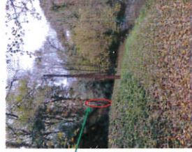
BT13 - Rue de la Salette 43.575146, 2.377899